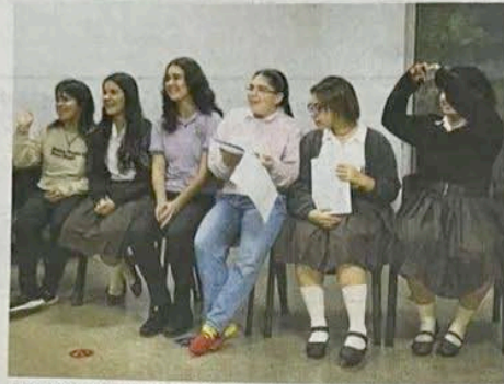
A la obra se le integraron testimonios y aportes de todos los talleres que fueron convocados.

Las prácticas artísticas desarrolladas en estos ejercicios ayudan a recomponer lazos de solidaridad que, en muchas ocasiones, se tradu-